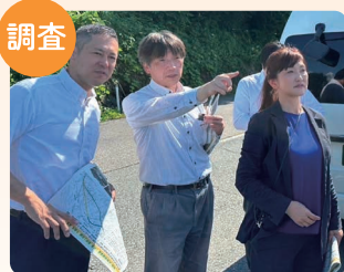
姨捨ブユースポット予定地の調査