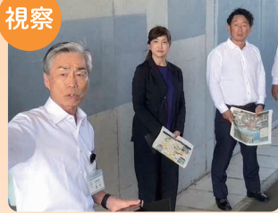
屋代スマートIC(仮称) 予定地視察