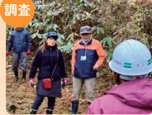
善光寺道 現地調査