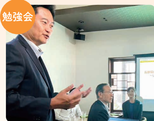
県建設部長を地元へ招いて勉強会