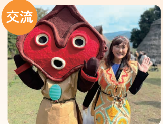
さらしなの里 縄文祭りにて交流

（5）人口戦略を進め、女性から選ばれる県を目指すためには、フェムテックの推進が重要であり、例えば、経営陣の意識改革などの取組を進める必要がある。女性の健康や生活の質を向上させ、キャリアを支えるために、県としてどのような取組を進めていくか、所見を伺う。（阿部知事） （4）広島県三原市役所では、管理職向けに「生理研修」を実施し、生理に関する正しい知識を広め、休暇が取りやすい環境作りを進めている。長野県でも女性特有の健康課題やフェムテックの理解を深めるための職員研修の実施が必要と考えるが、所見を伺う。（渡辺総務部長）