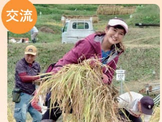
姨捨の棚田で稲刈り交流