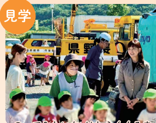
のってみたいな はたらくくるま あんずの里保育園