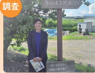
沢山川水害対策 現地調査