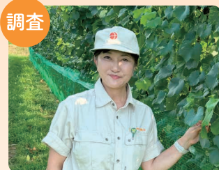
千曲・坂城のワインぶどう畑調査