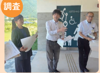
千曲川サイクリングロード現地調査