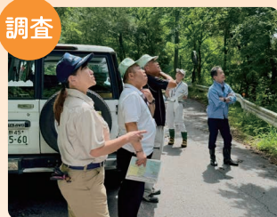
大田原にて道路等の現地調査